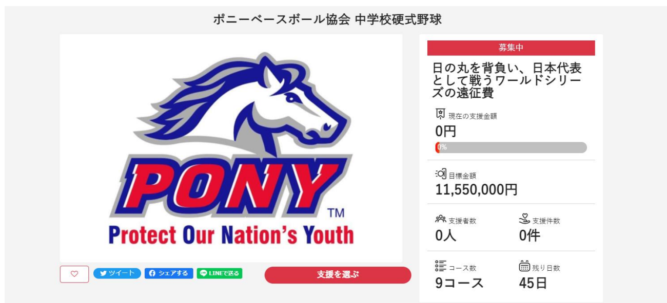
募集ページのイメージ

ライブリッツは、用具購入や遠征などにかかる活動資金、さらに選手の技術やチーム力の向上に貢献するITツールの導入といった強化資金を捻出したいと考えている高校・大学の運動部やアマチュアチームをサポートするために「BARREL ZONE」を立ち上げました。「BARREL ZONE」を利用することで選手の家族や地元、学校の卒業生など近い関係者に加え、全国に幅広く支援を募ることができます。また、プロジェクトをPRするなかでチームを熱心に長期的に応援してくれるサポーターに出会える可能性が広がります。